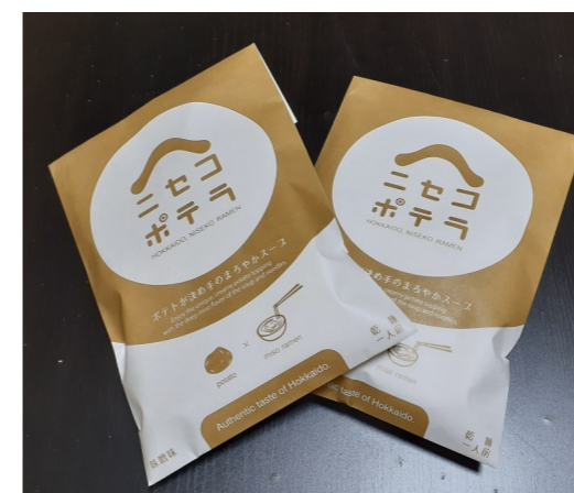
ニセコラーメン ポテラ 北海道虻田郡真狩村緑岡174-3 真狩温泉内

「ニセコラーメン ポテラ」の袋詰め作業を請け負っています。味噌スープにふわふわのポテトムースが絡みつくと新食感のラーメンです。