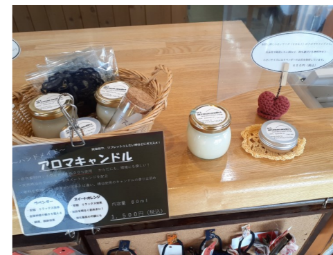
アロマワックスサシェ…800円 アロマキャンドル…缶650円、びん1,500円