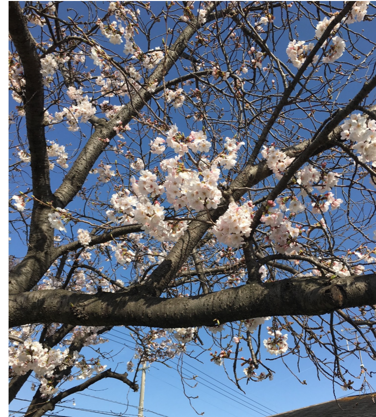
一足早い桜の便り〜福岡県にて 3月27日