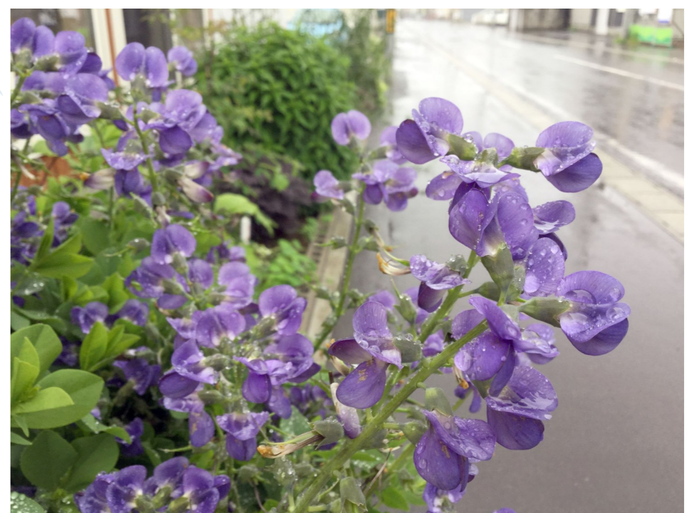
雨に濡れるムラサキセンタイハギ わっくわく花だん