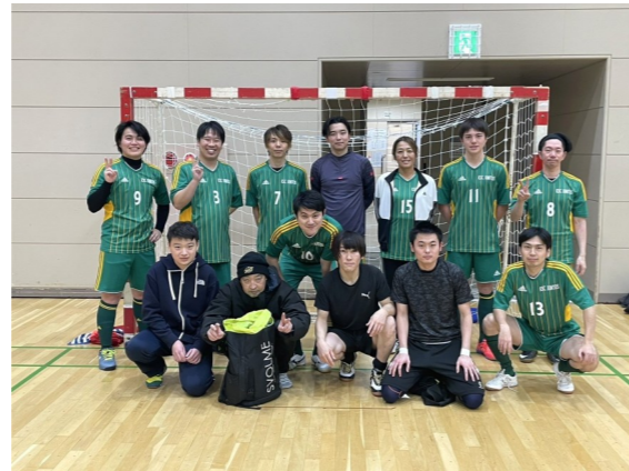
5位に入ったK.S.C. Juntos United