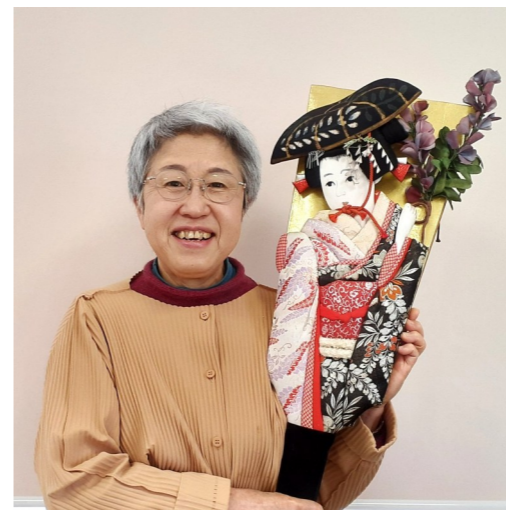
亡き母手作りの羽子板と

年頭に当たり新年のご挨拶を申し上げます。 本年から年賀状での年始のご挨拶をやめさせていただきましたが、皆様お元気で佳い年をお迎えでしたでしょうか？ 昨年元旦の能登半島地震、そして9月の集中豪雨で再び被災された方々の事を思う時、当たり前の生活がこんなにもありがたいことなんだと改めて思います。また「明日は我が身」に備えての対策はどうか？事業所内の連絡網だけでなく家族とは大丈夫か？自宅の災害備蓄物資は？と見渡すと・・・大丈夫じゃない！！(皆さんはどうですか？) 昨年は認定NPO法人の認定を受けて10年が経ち、2回目の更新で3人の道職員を現地確認にお迎えしました。皆様から毎年ご寄付を頂けていることに感謝申し上げます。