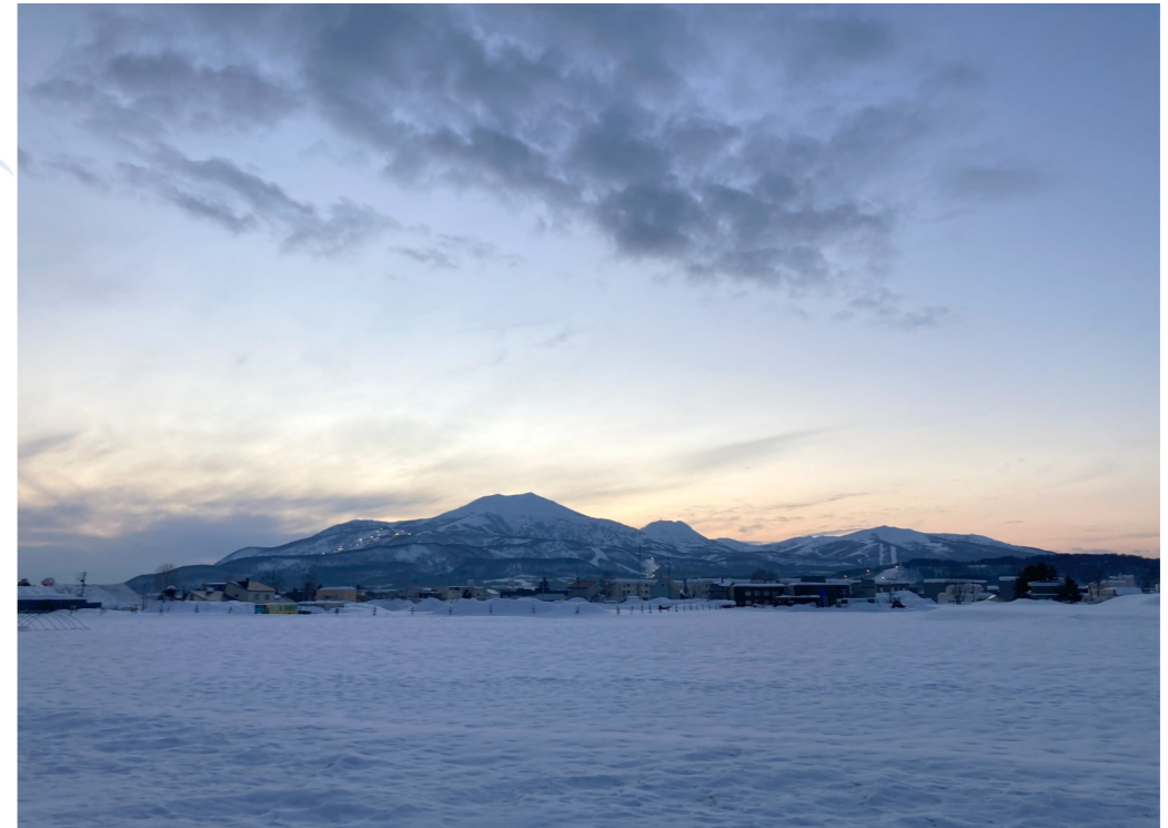
1月23日、倶知安町富士見橋付近から撮影