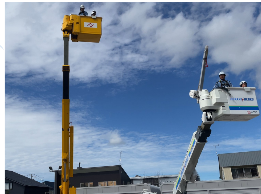
9月7日 倶知安町役場にて撮影