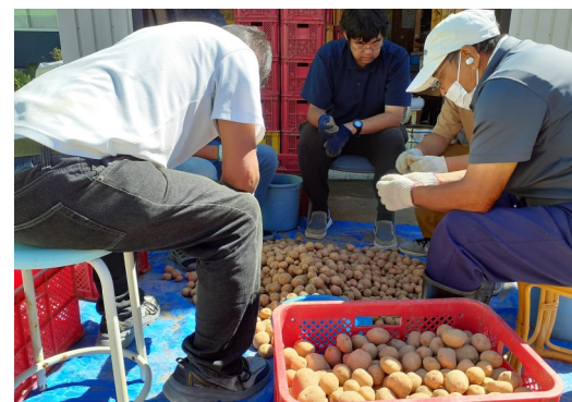
手作業で丁寧を選別