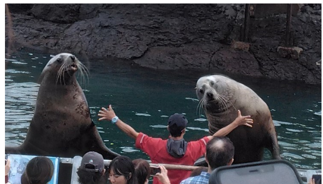
トドのショーは大迫力