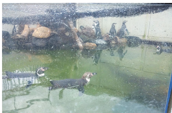
ショーに出演するフィンボルトペンギン