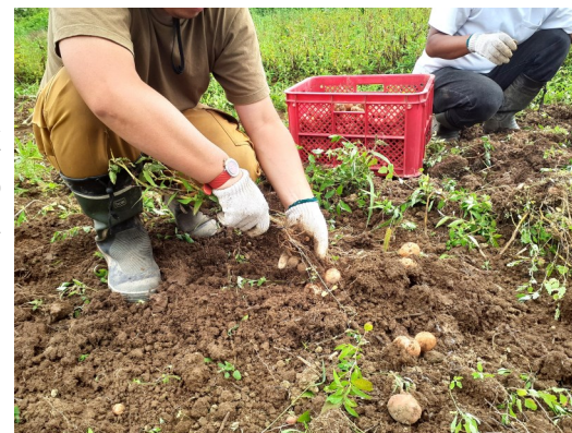
まだ暑さ残る8月末に収穫