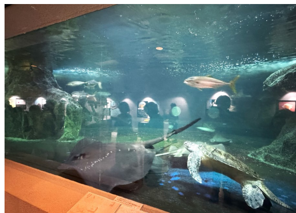
おたる水族館最大の回遊水槽