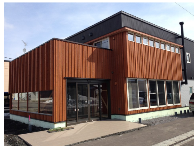
就労継続支援B型事業所