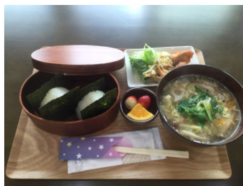
カフェで提供するランチ