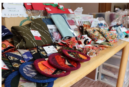
わっくわくまつりにて