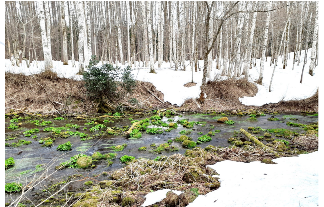
残雪残る山中に育つヤチブキ (エソノリュウキンカ)