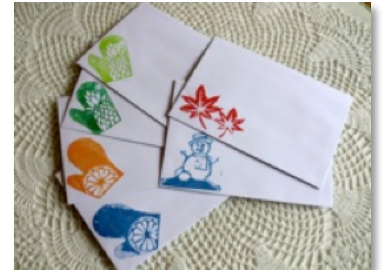
消しゴムスタンプの封筒 ①ホテルようてい 4枚セット 150円