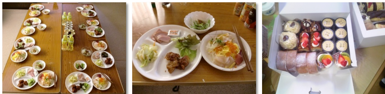
調理部特製の海鮮丼にさまざまな料理、デザートにはケーキもつきました。ビンゴ大会は大盛り上がり！

毎日の昼食調理のほか、月一回をめぐりにバイキング形式で食事を提供しています。昨年12月24日にはクリスマス会を開きました。