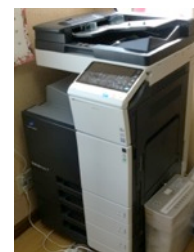
コニカミノルタ Bizhub C284

「障がい者の工賃向上に貢献する活発な広報活動!」に10月1日45万円の寄付金をいただき念願の最新式コピー機(約80万円)を購入することができました。買いたくなるパッケージづくりや作品・商品の写真カタログ作りにきれいな印刷で大活躍しています。