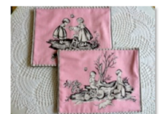
コースター ⑤いこ〜る 一個 400円

※品名の下丸数字は、左記の店番号です。 ※売り上げはすべて利用者の工賃になります。 ※くわしくは店頭、もしくはブログでどうぞ。