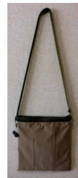
バッグ ⑤いこ〜る 1,500円