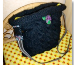
毛糸のバッグ ③家具の松塚 2,000円