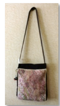
バッグ(ストレートスラッシュ) ⑤いこ〜る 3,000円