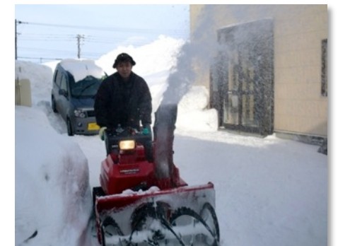
郵便事業助成で購入した除雪機も大活躍

今シーズンの実績は、個人宅8軒、商店・クリニック・宿など6軒で収入も60万円超す見込みで昨年より大幅に増えました。筋肉痛と戦っています。