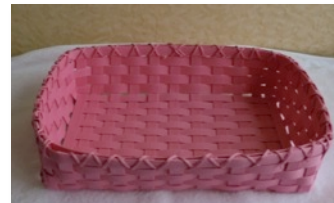
手編みかご ⑤いこ〜る 1,980円