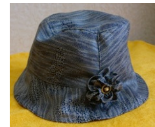
帽子 ⑤いこ〜る 1,500円