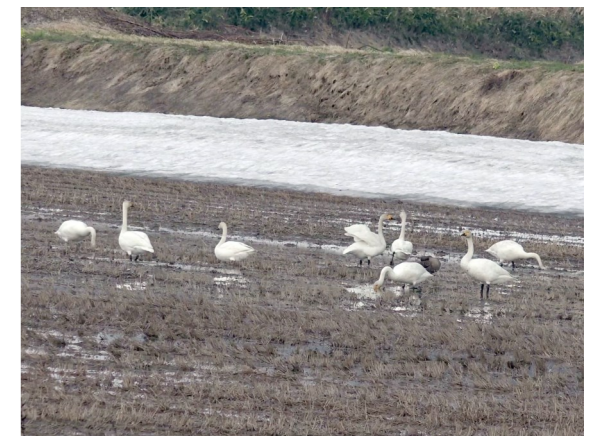
羽根を休める小白鳥の群れ