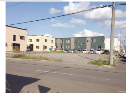
建設前の「わっくわく」敷地

こうして動き出したわっくわく事業でしたが、人手不足などで施工業者がなかなか決まりませんでした。ようやく決まったのが平成26(2014)年9月1日の2度目の入札でのこと。交付金の期限が26年度いっぱいだったこともあり、3週間後の19日から急ピッチで工事が始まりました。そして平成27(2013)年2月に「わっくわく」は完成、引き渡しを受け、3月から本格的に始動したのです。