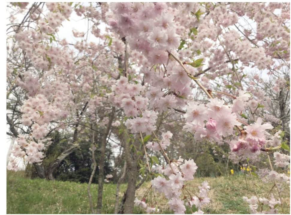
一足早い東北の春