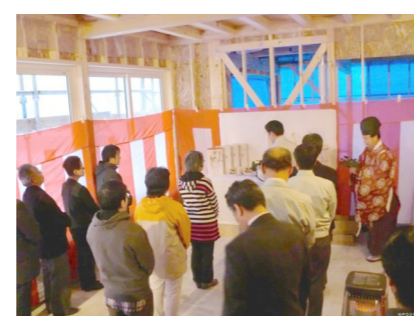
平成26年11月13日 「わっくわく」上棟祭