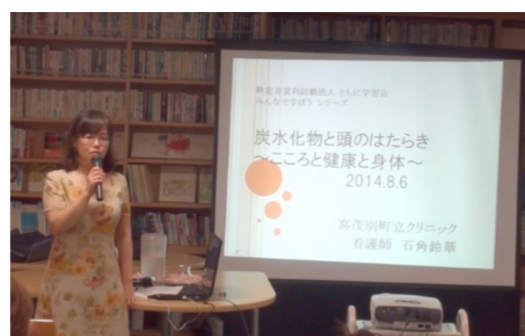
平成26年8月5日開催「炭水化物と頭のはたらき」の講座風景。