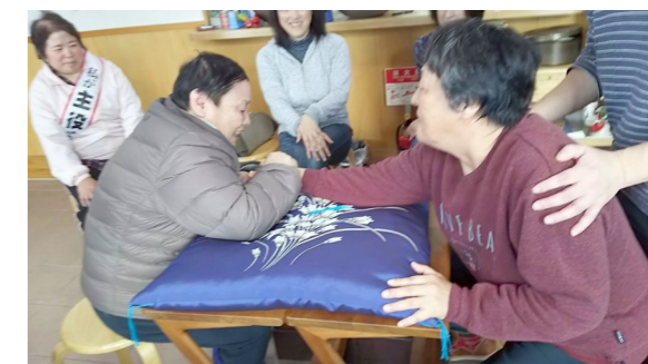
新年会、熱闘腕相撲

新年最初の開所日の1月9日を前に、さまざまなイベントを開きました。第1日は新年会、焼きそばをみんなでつくって食べ、ゲームをして盛り上がりしました。