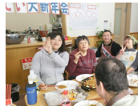
おいしいもので新年を祝う

ビデオで映画をみんなで鑑賞しました。引きこもりの男の子がロボットを使って活躍する映画で、ハラハラしながら観ていました。