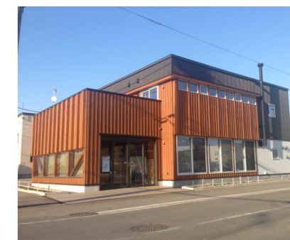
グループホームまどか (わっくわく)

2人体制を継続し平日日勤者数を確保するため、新たに夜勤業務ができるグループホームの常勤職員を募集しています。お心当たりの方はハローワークにお問い合わせください。