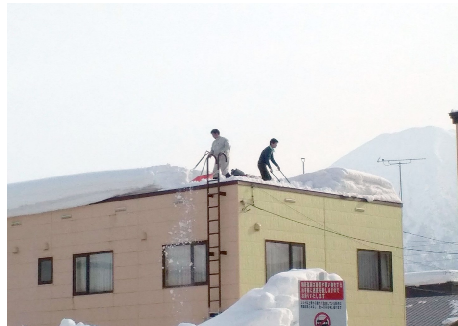
1月17日 ワークショップ製造部棟の作業を撮影