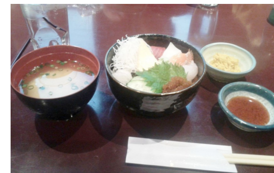
毎年利用者が心待ちにしている海鮮丼

今回も「創作和食レストランテさかもと」さんの海鮮丼*3を食べ、一年間の労をねぎらいました。