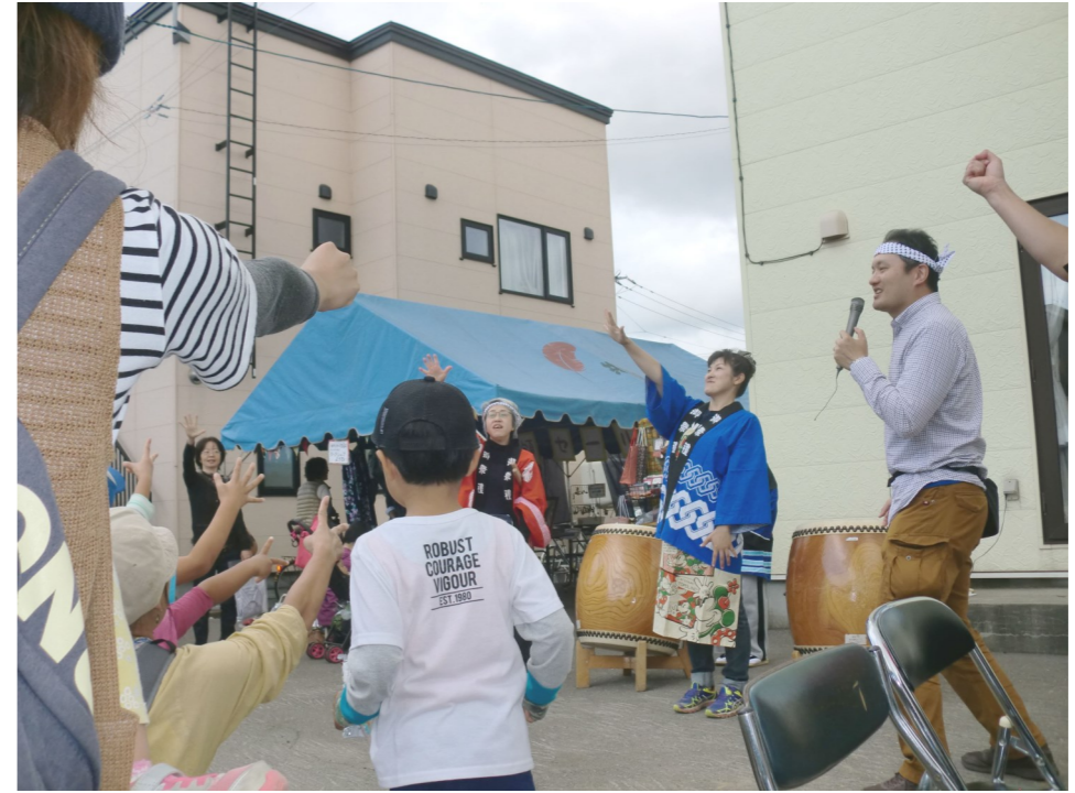
わっくわくまつりの記事は見開きをご覧ください。