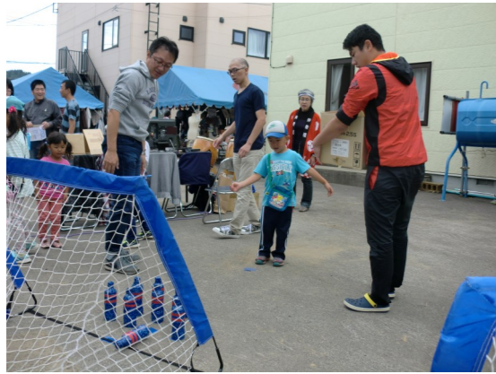
今年のK.S.C. JUNTOS寄付金活動はなんと17,282円集まりました！遠征費などに活用させていただきます。