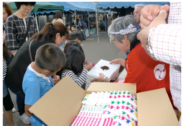
残念ながら当たらなかった方のために子どもは飴のつかみ取り、大人はティッシュを差し上げました。