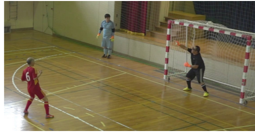
ブロックBの順位決定PK戦。JUNTOSが2位を決めたPK