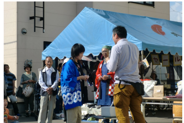
ワークショップようてい利用者担当の抽選会は大盛り上がり。番号を読むことに歓声がありました。