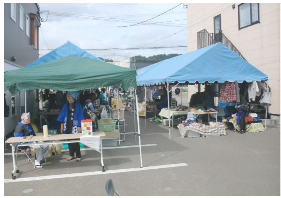
今年のフリーマーケットは13店が軒を連ね小物や衣類など個性的な商品が売り出されていました。