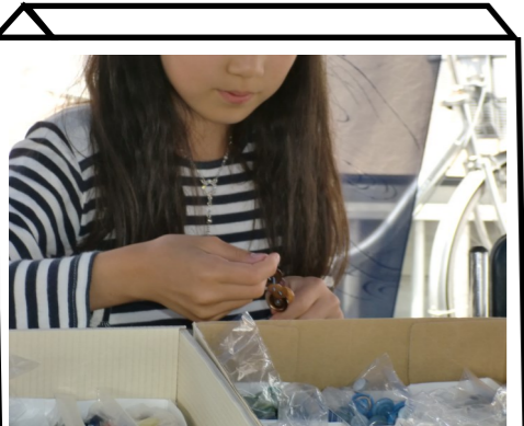
ワークショップようてい製造部はボタンデコレーション体験。あざやかな飾りに子どもたちもにっこり。