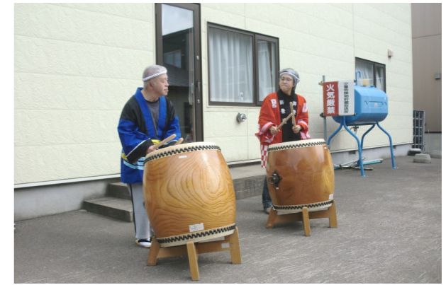
太鼓の音が響きわたり、わっくわくまつりは高らかに閉会を言いました。