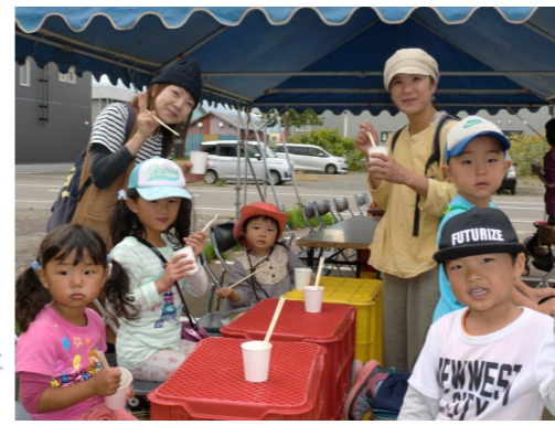
今年は夢の匠さま、喫茶陽だまりさまに出店協力をしていただきました。