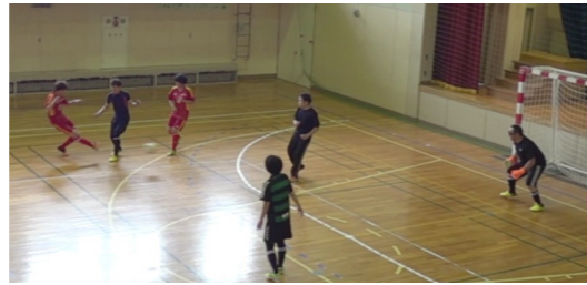
JUNTOSが初勝利を決めた先制ゴールの瞬間