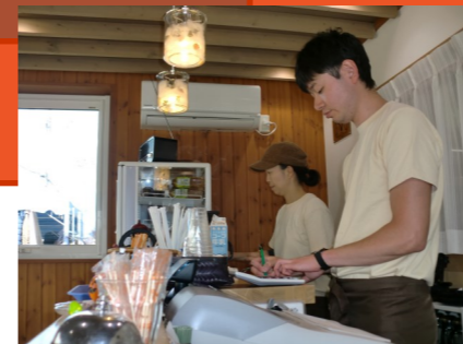
この日はカフェも臨時営業し、豚汁&おにぎりセットを300円で提供しました。