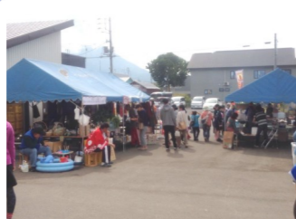
抽選会 場内でお買い物された方に抽選券をお渡しします