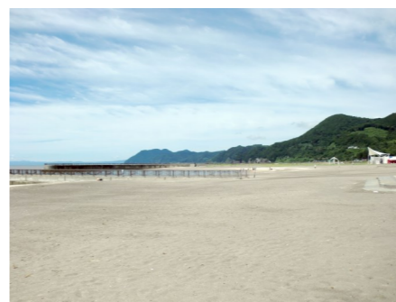
前日に大雨が降って心配しましたが、当日はごらんのような晴天に恵まれました。

実行委員のみなさんは2か月も前から準備をし、当日も運営に走り回っていました。それぞれが思い出を持つことができた今回の海水浴でした。