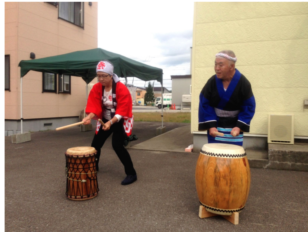
開幕を告げる太鼓乱舞（即興「ノブ」）