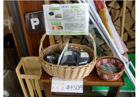
農業部は季節で穫れた野菜を販売します。オフシーズンの今は豆を販売中。