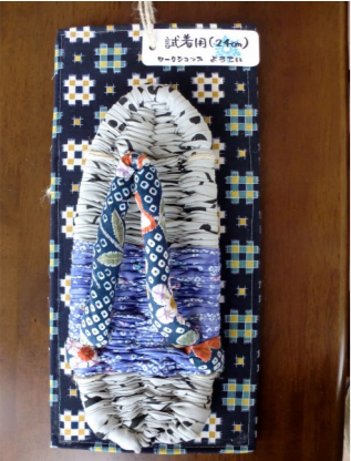
試し履きができる布ぞうり

カフェで買っていただくと、他店での委託販売手数料がないので、収益増となり利用者工賃アップにつながります。どうぞお買い求めの際はカフェ店員へお声をかけてください。もちろんお買い求めのみで来てくださるのもOKです。みなさまのお越しをお待ちしております。