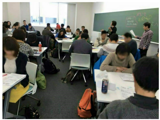
（写真は加工しています）