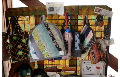
リサイクル着物を使った商品。ポットカバー、お薬手帳カバー、ペットボトルホルダー、しおりなど