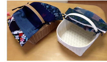
バスケット（カバー付き）