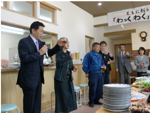
町長の祝辞と乾杯で いよいよ式典開始