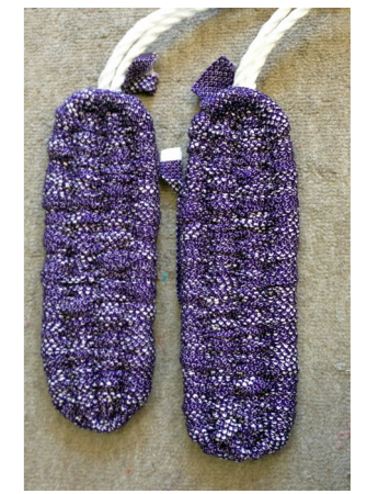
布で編み込むぞうり（製造途中）（一度履くとやめられない！）

製造部は日々ものづくりに励んでいます。目標は夏から秋にかけてのイベント販売、売切れが出た「いこ～」冬物。利用者にはそれぞれ得意なものとそうでないものがあり、障がい特性もさまざまなので、その人ごとにできる作業を設定し工夫しながらアドバイスしています。 一点ものだけれども同じタイプの製品を同じ品質で量産できるようにすることが課題です。努力していきます。 利用者や製造部職員が、細部にまで丹精込めて作ったこの商品。札幌の「いこ～」などで販売します。