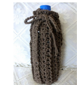
サマーマーヤンのペットボトルの