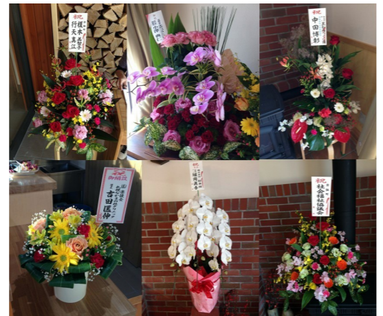
たくさんのお花やご祝儀をいただきました。

祝賀会欠席の方から寄せられた祝辞 ・「わっくわく」のスタートを心よりお祝い申し上げます。地域の和が大きく広がっていくことを期待しております。 ・「わっくわく」の完成、おめでとうございます。ご案内いただきありがとうございます。 ・このたびはおめでとうございます。都合で出席できませんが、みなさまのご活躍を願っております。 ・完成祝賀会ご案内いただきありがとうございます。地域に根ざしました業務推進めざしてがんばってくださいませ。