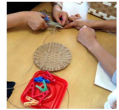
職員の指導を受け、バッグの飾り部分を編む

現在作っているもの ・ペットボトルケース（サマーマーヤン、保冷シートつき） ・布地のぞうり ・シュシュ ・カバー付きのバスケット ・編み物（帽子、レッグウォーマーなど（来シーズンの冬に向けて製作中）） ほか