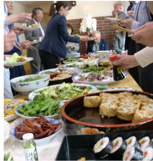
ワークショップ調理部職員が腕によりをかけて作った料理