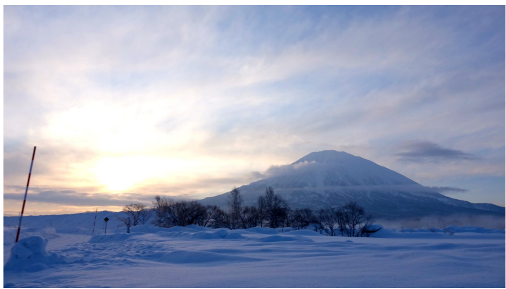
羊蹄山の初日の出※