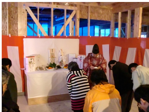
⇒工事と建物の無事を祈願した上棟祭

建物の形が見えてきた「わくわく」新事業所。季節は冬に入りますが、工事は熱をおびて活気づいています。