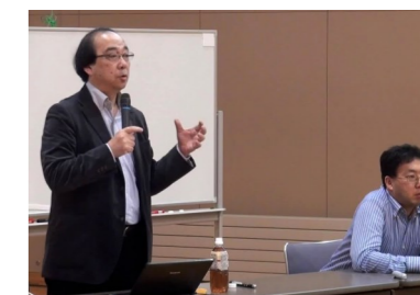
こころのルネッサンス