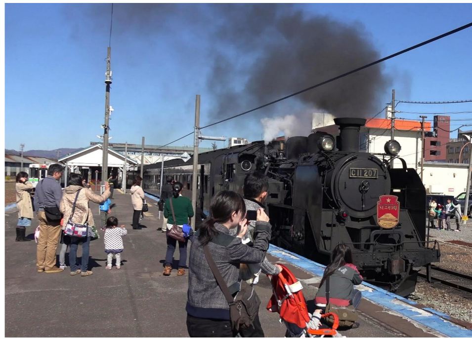
10月26日 倶知安駅にて撮影