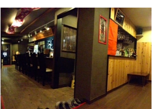
ゆったりくつろげる店内

創作和食 レストラン きかもと 俱知安町北1条西1丁目 17時30分~23時 火曜休 Tel (0136)22-0556 にんじんのコロック、キャロコロ が食べられるのはこの店だけ!