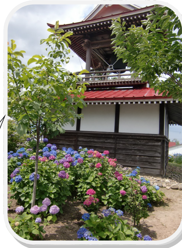
共和町 明善寺さんのあじさい

皆さんのコメント カメラのアングルをどう すればよいか、悩みながら 写しました。