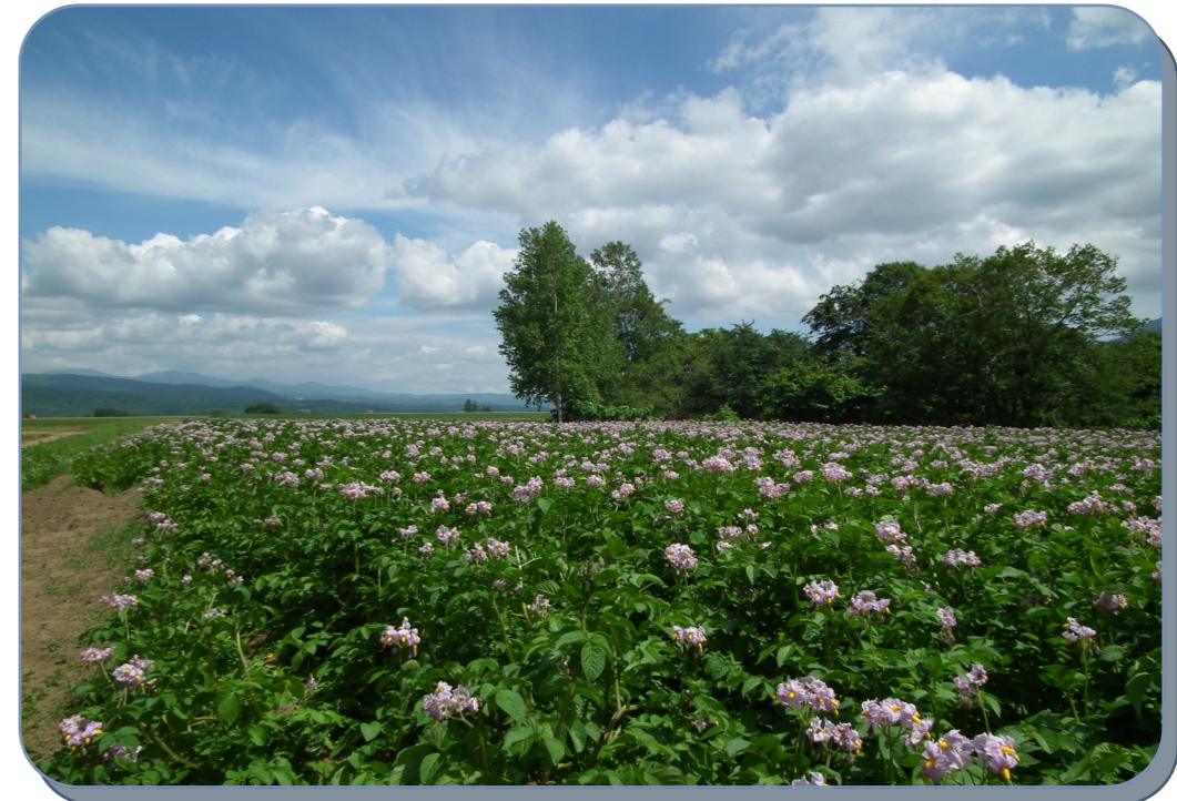
じゃがいもの花/農業部農場

Oさんのコメント カメラ趣味はまだ日が浅いですが、 撮影しているときは楽しいです♪