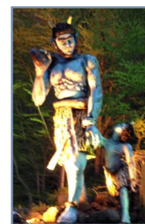
ホテル石水亭さんで出迎えた鬼の親子

5月16日と17日、利用者の企画で登別市まで一泊旅行をしました。一日目はホテル石水亭の中でゆっくりと過ごしました。