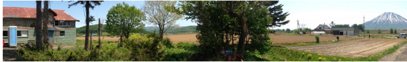
設置した簡易トイレ（左端）より、向かい側の畑までをパノラマ写真で撮影しました。

赤い羽根共同募金さまより、このたび畑に設置する簡易水洗トイレの助成金をいただき、さっそく6月に設置しました。これで農作業中にトイレを済ませられるようになり、作業効率が格段に良くなりました。紙面にてお礼申し上げます。ありがとうございました。