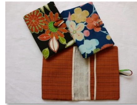
おくすり手帳 コスモ調剤薬局で販売しています。

「たびつむぎ」、「家具の松塚」、「ホテルようてい」、「元気ショップ いこ〜る」で好評発売中です。またおくすり手帳を新たに「コスモ調剤薬局」さまで販売開始しました。