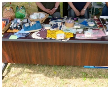
育成会全道大会の販売（製造部）